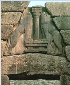
Puerta de los leones, Micenas

Esta etapa coincide con el apogeo de la civilización creto-micénica . Las manifestaciones literarias de este período fueron en verso y se caracterizó por la oralidad.